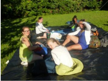
Jeunes au lever du Camp de celles qui ont été à Crest

La journée en autonomie permet aux Ados de choisir un objectif de randonnée et de l'accomplir avec ou sans animateurs, selon les âges. Certains sont descendus à Aouste ou à Crest pour connaître la vieille ville, d'autres sont montés au sommet du « Bec Aouste » (1015 m), d'autres sont allés à l'Intermarché de Crest... La civilisation leur manque... Les équipes d'animation ont respecté leur projet et les ont invités à aller jusqu'au bout : revenir de Crest à 14 h à 30°C pour faire 10 km pour retourner au camp, c'est un vrai défi !