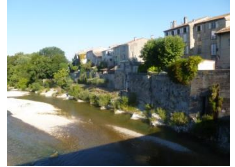
Paysage de marcheurs du sommet de la Drôme 1015 m et chemins vers les sommets